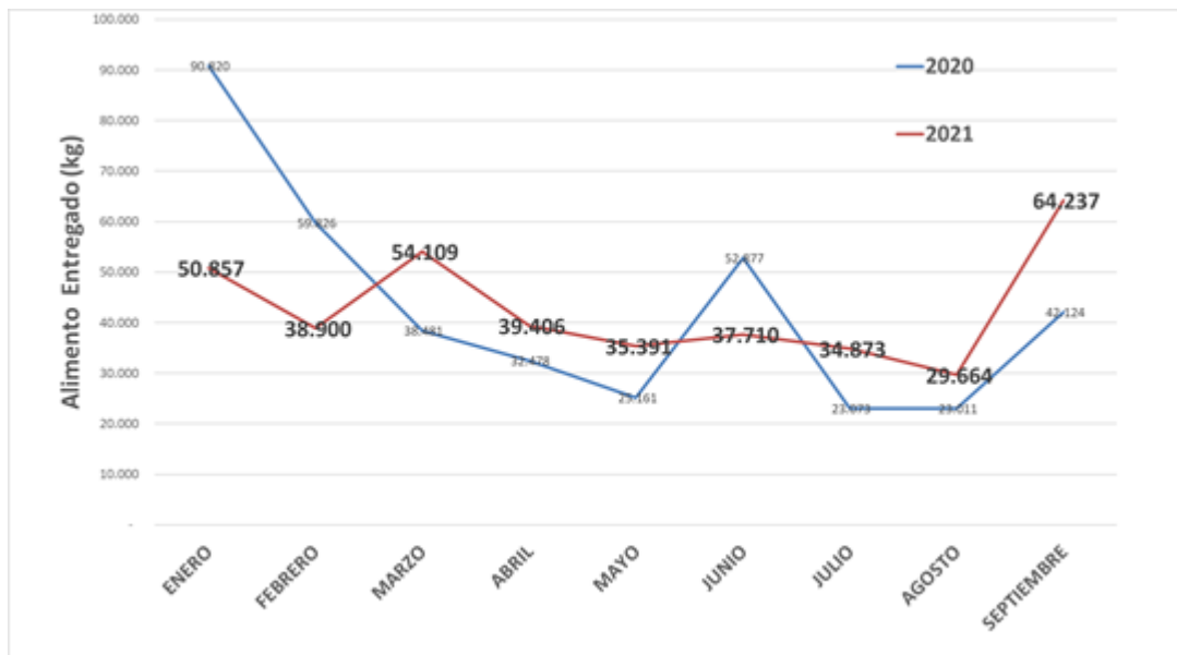
Gráfico 1: Tendencia mensual de la entrega de Frutas, Verduras y Otros (en kilogramos) a través del año 2020 y 2021

En Gráfico 1 se presenta la tendencia que ha mostrado la entrega de Frutas, Verduras y Otros mensualmente, durante los años 2020 y 2021.